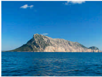
Isola di Tavolara

Nell'immaginario collettivo, nella fantasia e nelle realizzazioni cinematografiche si deve andare oltre la realtà per scovare luoghi ignoti o di rara bellezza per impressionare, affascinare o addirittura strabiliare nei reconditi ricordi storici per affrontare una nuova avventura.